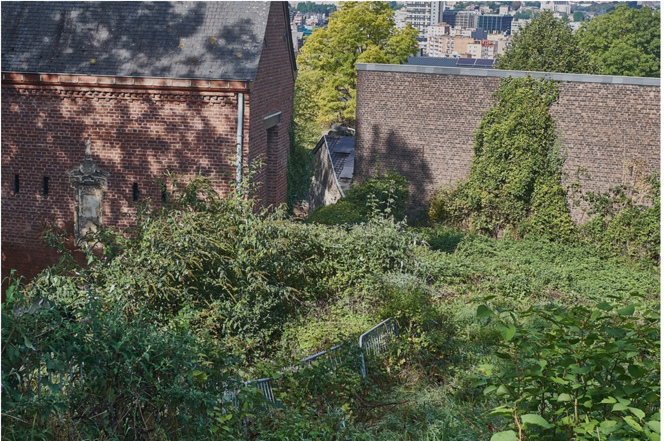
Etat du chemin d'accès de l'ârvô en septembre 2017