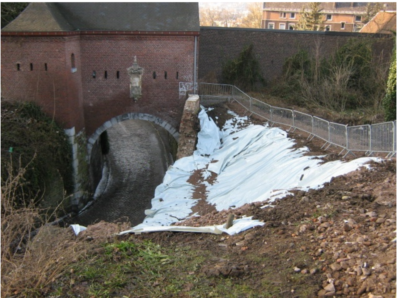
Etat du chemin d'accès après l'intervention de la Ville de Liège, 2009