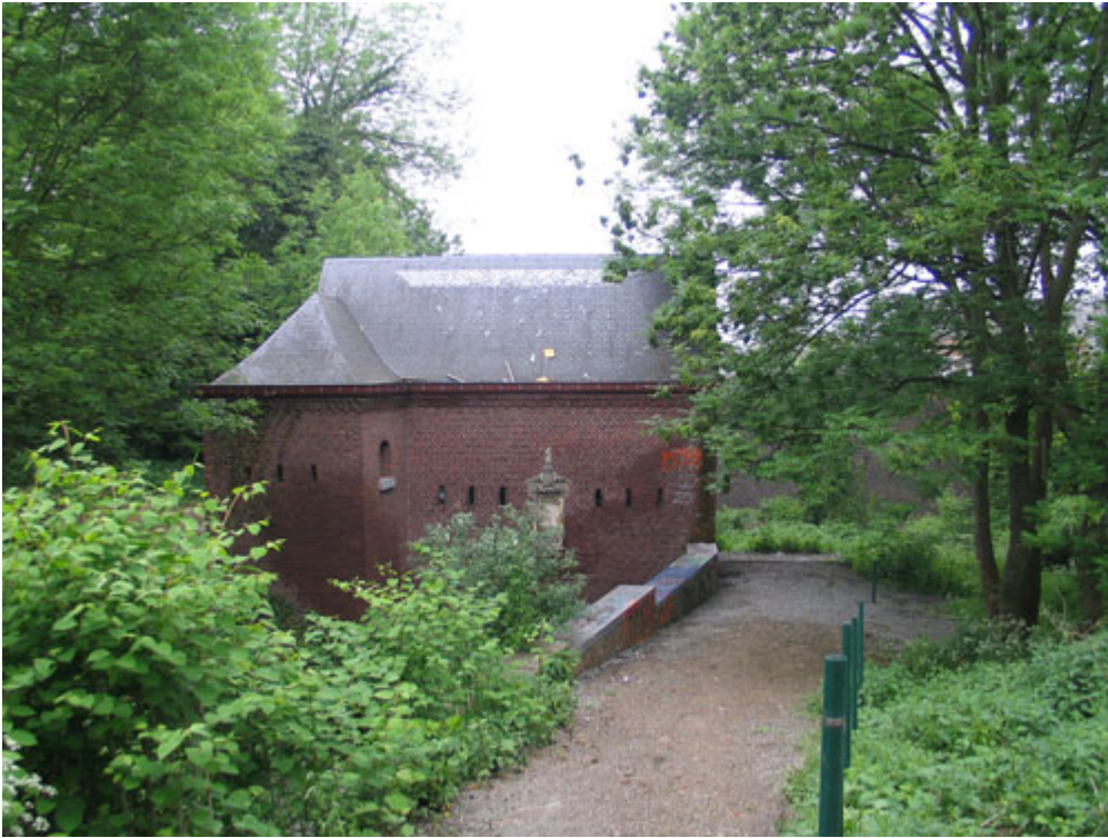
Etat du chemin d'accès de l'ârvô en 2008 avant sa destruction par les travaux effectués par la Ville de Liège