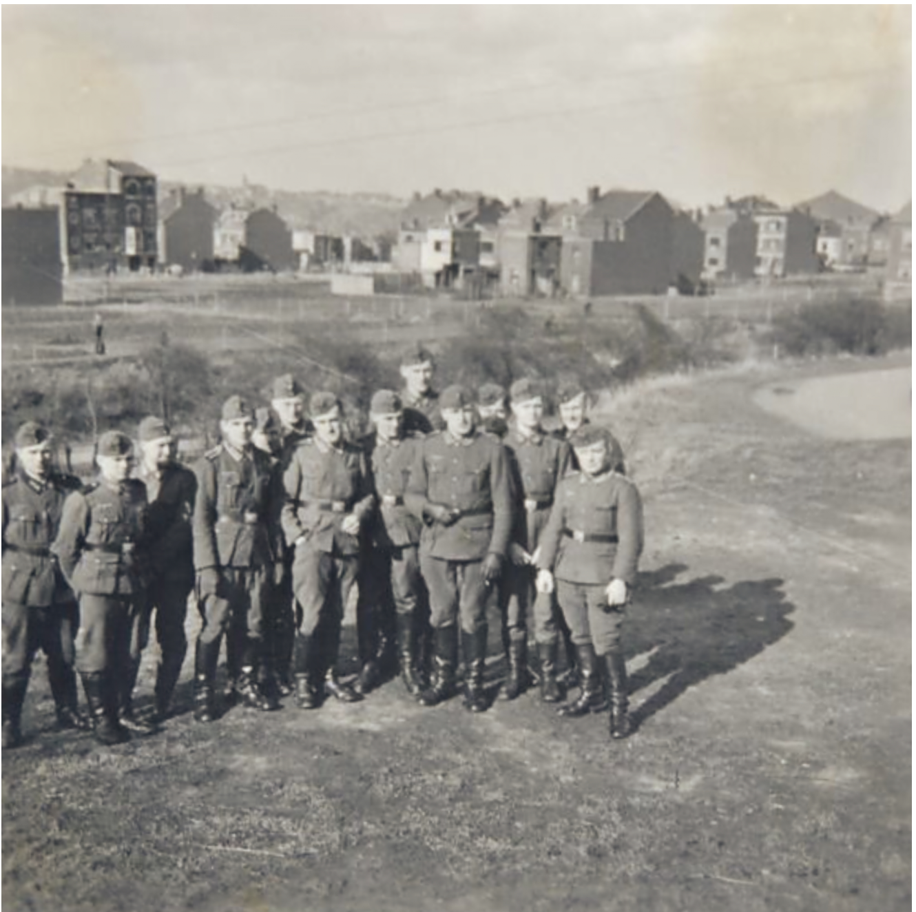
Soldats allemands posant en face de la caserne de la Chartreuse (2).