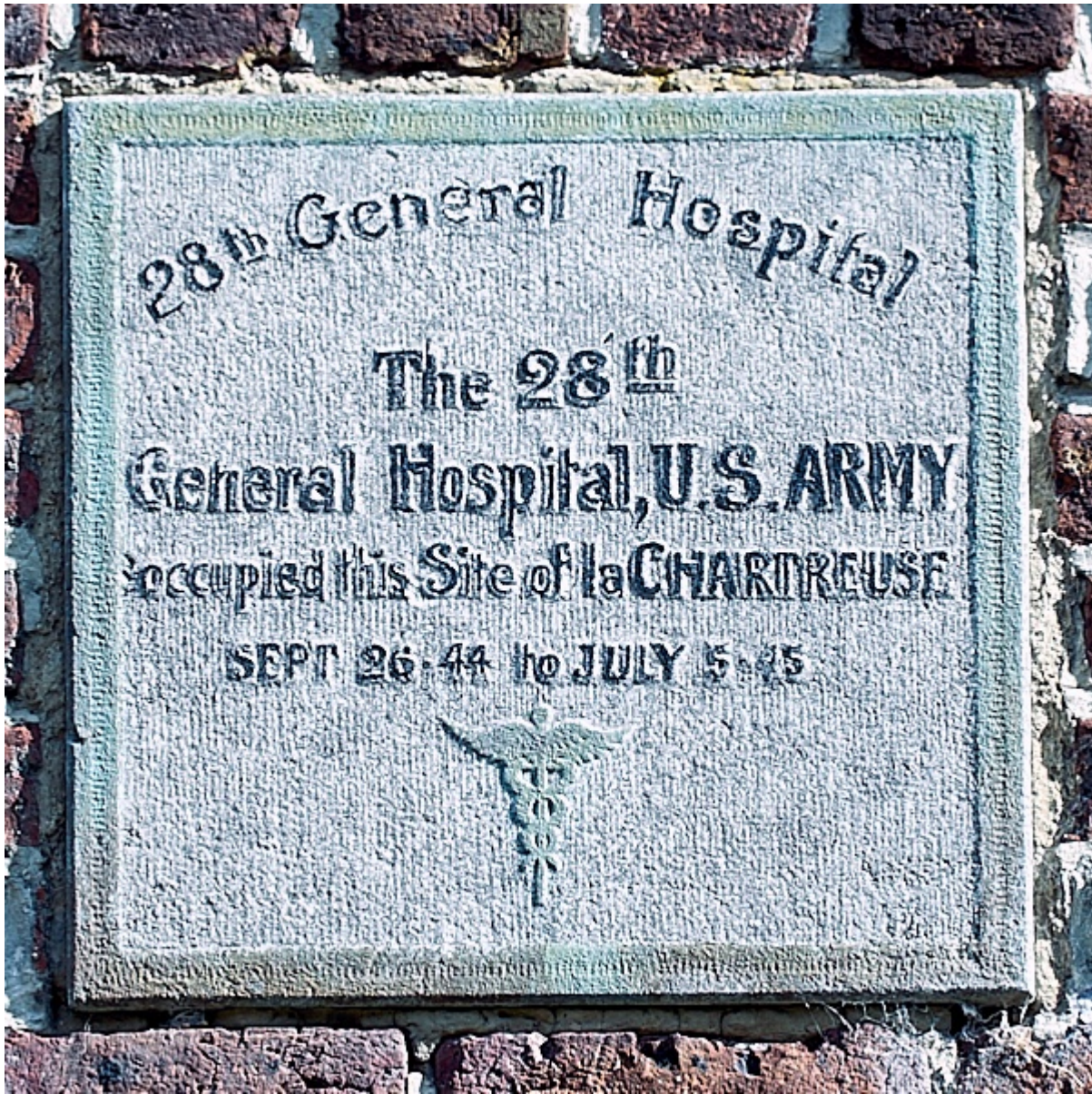
La plaque commémorative à l'entrée de l'ancien fort (5).