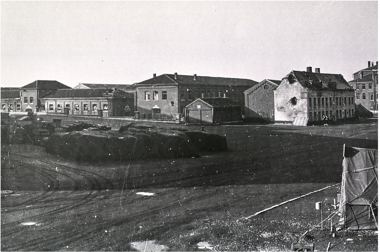
La maison Lambinon a encaissé le bombardement de septembre 1944 (10). Cliquez pour agrandir.