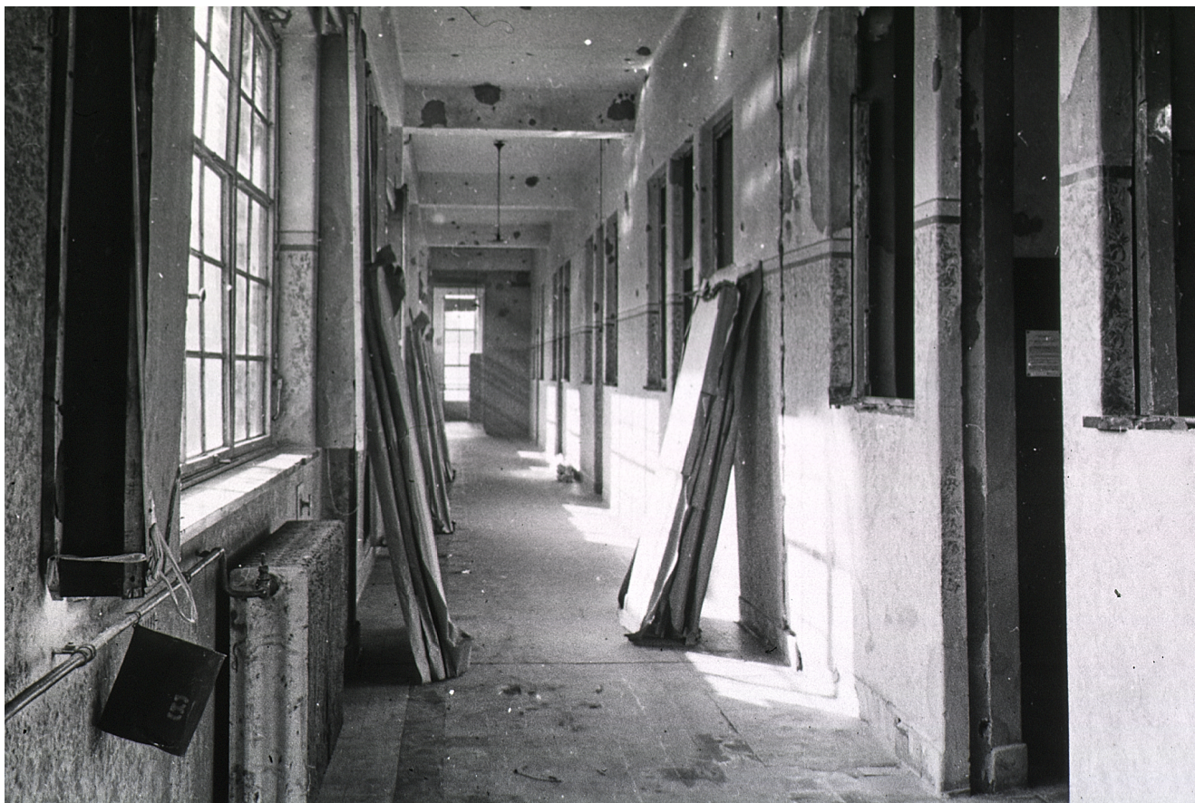
L'hôpital avant son aménagement (8). Cliquez pour agrandir.