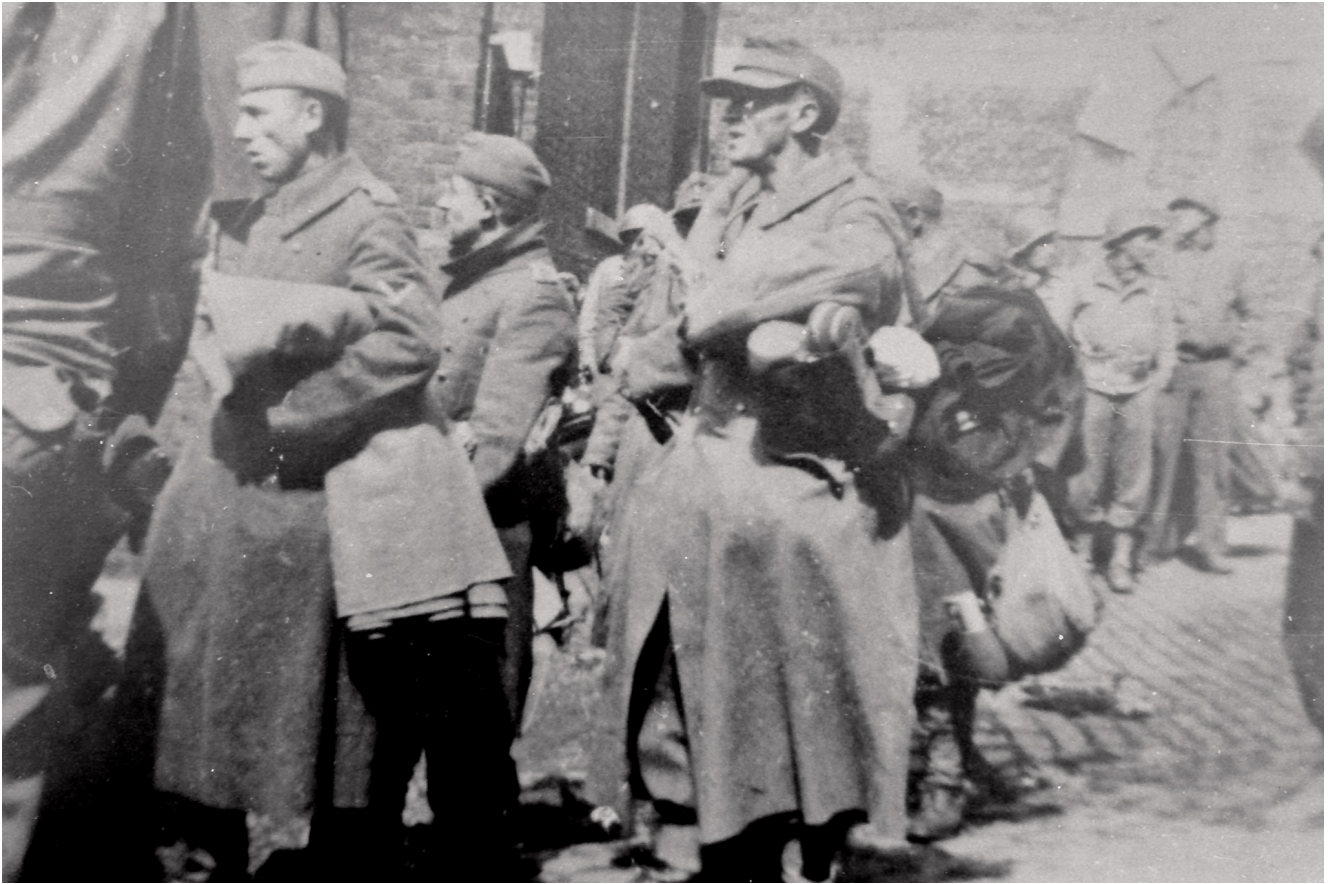
Prisonniers allemands quittant la caserne de la Chartreuse (3). Cliquez pour agrandir.