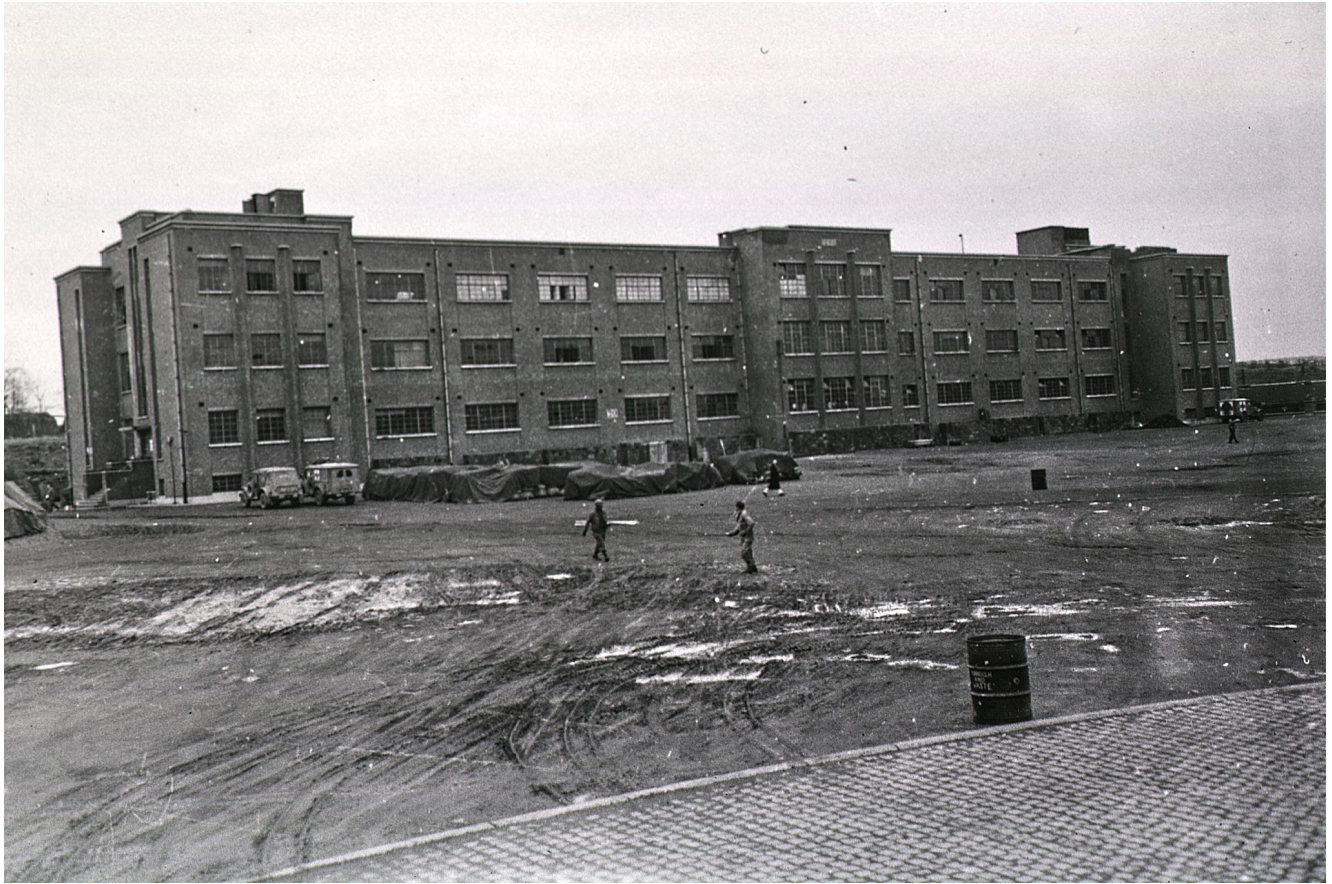
Les tentes du 28th General Hospital devant le bâtiment de la caserne qui sera aménagé (6). Cliquez pour agrandir.