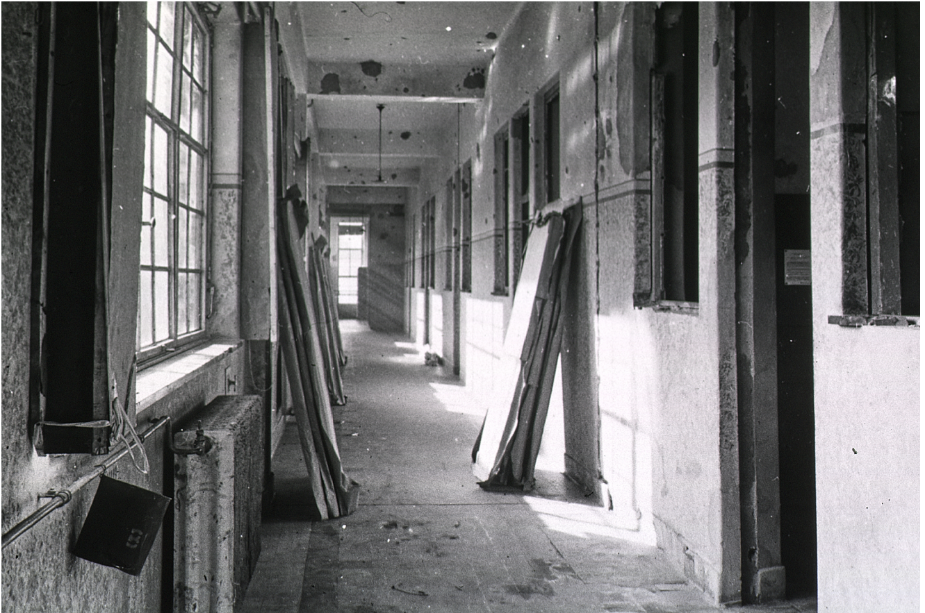
L'hôpital avant son aménagement (8). Cliquez pour agrandir.