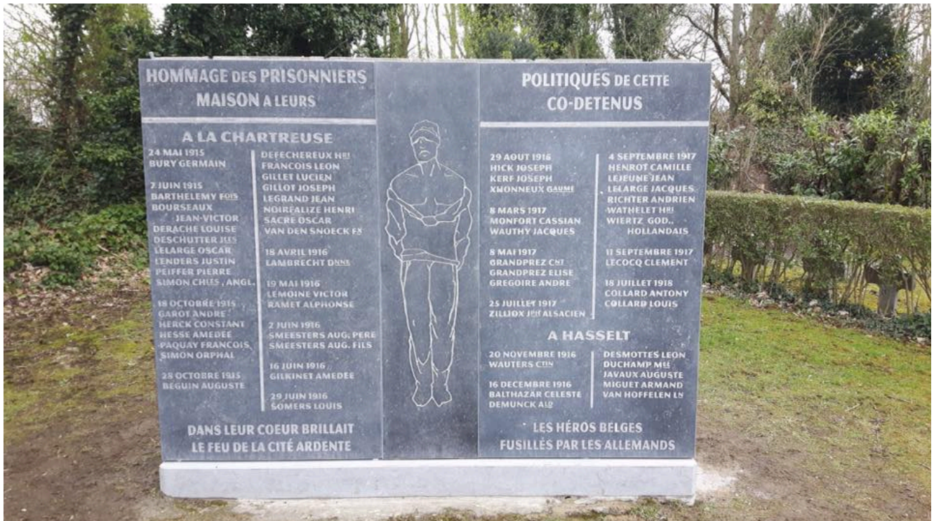
La nouvelle stèle Cliquez pour agrandir

Le Ministère de la Défense et la Ville de Liège se sont associées pour reconstruire un nouveau monument, sans plaque de bronze, cette fois. Il sera inauguré officiellement ce 25 avril 2018 à 10 heures lors d'une cérémonie organisée conjointement par le Commandement Militaire de la Province de Liège , la Ville de Liège et la Société Royale Le Bastion .