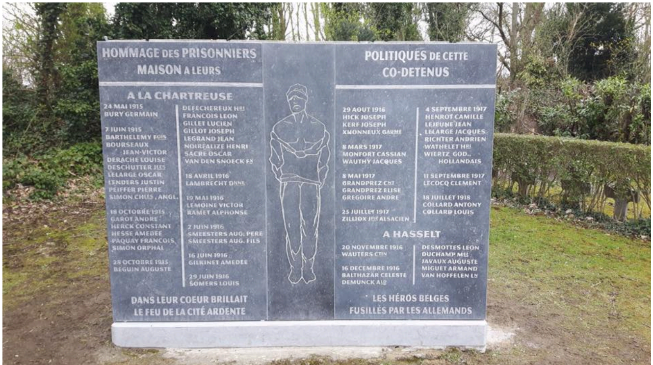
La nouvelle stèle Cliquez pour agrandir

Le Ministère de la Défense et la Ville de Liège se sont associées pour reconstruire un nouveau monument, sans plaque de bronze, cette fois. Il sera inauguré officiellement ce 25 avril 2018 à 10 heures lors d'une cérémonie organisée conjointement par le Commandement Militaire de la Province de Liège , la Ville de Liège et la Société Royale Le Bastion .